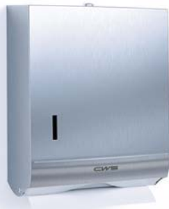
Faltpapierspender Edelstahl Art.-Nr.: 7622000

Faltpapierspender geeignet für Papierqualitäten in C-, V- und Z-Falzung | einfaches Herausziehen einzelner Faltpapierblätter | servicefreundliches Füllstandssichtfenster | Kapazität für ca. 300 Faltpapierblätter | Schloss zur Diebstahlsicherung