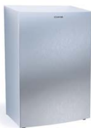
Abfallbehälter Edelstahl, 25l, Art.-Nr.: 7752000 Art.-Nr. Deckel, 25l: 307752000 Art.-Nr. Rahmen, 25l: 307752100

Grosse Einwurflappe | innenliegender und somit unsichtbarer Beutelhalter für den Einsatz von Müllbeuteln | mit selbstschliessendem Schwingdeckel oder offenem Rahmen | Deckel dient als Sichtblende | Deckeleinheit ist nicht hervorstehend | zur leichten Entnahme des Müllbeutels ist der Deckel abnehmbar und aufsetzbar durch spezielles Einrastsystem | ca. 25 Liter Volumen | schwarze Kunststofffüsse | freistehend oder für Wandmontage