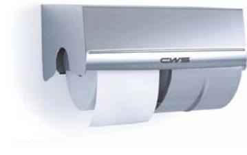
Toilettenpapierspender Edelstahl Art.-Nr.: 7604000

Kompakter Spender für geringe bis mittlere Benutzerfrequenzen | 2-Kammern-System – zwei Toilettenpapierrollen in einem Spender | ständige Verfügbarkeit durch Reserverolle, die erst nach Verbrauch der ersten Rolle freigegeben wird | kein endloses Abrollen durch integrierte Rollenbremse für sparsamen Gebrauch | einfaches Abreißen der Portion | Schloss zur Diebstahlsicherung