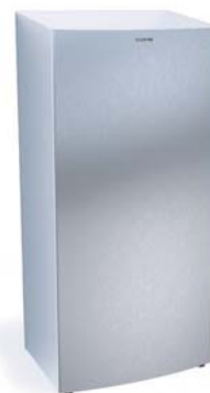
Abfallbehälter Edelstahl, 60l, Art.-Nr.: 7750000 Art.-Nr. Deckel, 60l: 307750000 Art.-Nr. Rahmen, 60l: 307750100

Grosse Einwurflappe | innenliegender und somit unsichtbarer Beutelhalter für den Einsatz von Müllbeuteln | mit selbstschliessendem Schwingdeckel oder offenem Rahmen | Deckel dient als Sichtblende | Deckeleinheit ist nicht hervorstehend | zur leichten Entnahme des Müllbeutels ist der Deckel abnehmbar und aufsetzbar durch spezielles Einrastsystem | ca. 60 Liter Volumen | schwarze Kunststofffüsse | freistehend oder für Wandmontage