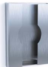
Hygienebeutelhalter (Polybeutel) Edelstahl Art.-Nr.: 7756000

Wandmontage sowohl durch Klebefestigung oder Schrauben möglich | Anbringung auf CWS Hygieneboxen möglich