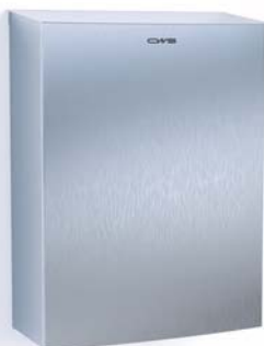
Hygienebox Edelstahl, 12l, Art.-Nr.: 7753000

Leicht aufklappbarer, selbstschliessender Deckel | innenliegender und somit unsichtbarer Beutelhalter für den Einsatz von Müllbeuteln | dank geringer Tiefe auch für kleine, enge Toilettenkabinen geeignet | ca. 12 Liter Volumen | zur einfachen Befestigung an der Wand