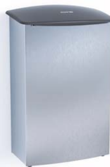
Hygieneboxbehälter Edelstahl, Art.-Nr.: 7776000 Deckel in schwarz, Art.-Nr.: 577200

Edelstahlbehälter für den Einsatz der CWS Kunststoff Ladycare Box im regelmässigen Tauschservice | für umweltfreundliche und fachgerechte Entsorgung von Damenhygieneartikeln | Hygienegel im Kunststoffbehälter sorgt für einen angenehmen Geruch | Sichtschutz durch speziellen Deckel der Kunststoffbox | automatisches Schliessen des Deckels durch Eigengewicht | Füllvolumen ca. 11 Liter | bodenstehend oder wandhängend