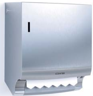
Rollenpapierspender Edelstahl Art.-Nr.: 7205000

Einfache Entnahme der persönlichen Papierportion | mechanisches „Non-Touch“-System – nur Berührung der eigenen Portion | schnelles Nachfüllen der Papierrollen durch „Easy-Loading“-System | Schneidevorrichtung gewährleistet bequemes, sauberes Abtrennen der Papierportionen | Drehrad (Notrad) für Papieraussgabe | keine Strom- bzw. Batterieversorgung notwendig