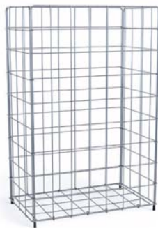
Papierkorb Edelstahl, 60l, Art.-Nr.: 750000 Papierkorbbalgerung für Wandmontage, Art.-Nr. 300301000

Edelstahlgeflecht | grosse Korböffnung | schwarze Kunststofffüsse | freistehend oder für Wandmontage | zusammenklappbar | ca. 60 Liter Volumen | vorzugsweise für grosse, stark frequentierte Waschräume geeignet