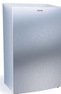
Abfallbehälter Edelstahl, 40l, Art.-Nr.: 7751000 Art.-Nr. Deckel, 40l: 307751000 Art.-Nr. Rahmen, 40l: 307751100

Grosse Einwurflappe | innenliegender und somit unsichtbarer Beutelhalter für den Einsatz von Müllbeuteln | mit selbstschliessendem Schwingdeckel oder offenem Rahmen | Deckel dient als Sichtblende | Deckeleinheit ist nicht hervorstehend | zur leichten Entnahme des Müllbeutels ist der Deckel abnehmbar und aufsetzbar durch spezielles Einrastsystem | ca. 40 Liter Volumen | schwarze Kunststofffüsse | freistehend oder für Wandmontage