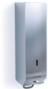
Seifencremespender Edelstahl Art.-Nr.: 7001000

Bedarfsgerechte Seifenqualitäten | „Click-in-Bottle“-System (schnelles Austauschen der Seifenkartusche) | Seifencremes sind biologisch abbaubar | Seifenrezepturen entsprechen EU-Richtlinien für kosmetische Produkte und sind dermatologisch getestet | 1.000 ml = ca. 1.600 Portionen | Reservetank = ca. 160 Portionen