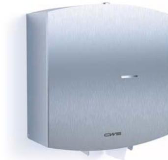
Toilettenpapierspender Edelstahl Art.-Nr.: 7630000 Karussell für 4 Standardrollen Art.-Nr.: 307630000

Grossrollen- bzw. Standardrollen-Toilettenpapierspender für stark frequentierte Waschräume | spürbar geringerer Befüllungsaufwand | Sichtschlitz als Füllstandskontrolle | beidseitig verwendbare Abrisskanten | einfache und sichere Befüllung durch klappbaren Deckel mit Fallsicherung | Einsatz von 1 Grossrolle oder 4 Standardrollen (mit 4-fach-Karussell) möglich | integrierte Rollenbremsen sichern einen sparsamen Verbrauch | Schloss zur Diebstahlsicherung