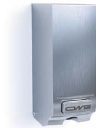
Toilettsitzreiniger Edelstahl Art.-Nr.: 7567000

Manuelle Reinigung des Toilettsitzes | schnell trocknendes, antibakteriell wirksames Reinigungsmittel* | entspricht den Kriterien nach EN 1276 (bakterizide Wirkung) und EN 13697 (bakterizide und levurozide Wirkung) | Flüssigkeit ist nach VAH/DGHM zertifiziert | einfache Handhabung und tropffreie Sprayabgabe | Druckknopf für exakte Dosierung | ca. 1.500 Sprayportionen pro 300-ml-Liquidbeutel