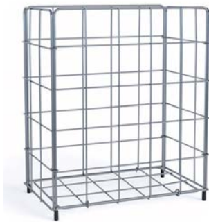
Papierkorb Edelstahl, 25l, Art.-Nr.: 752000 Papierkorbbalgerung für Wandmontage, Art.-Nr. 300301000

Edelstahlgeflecht | grosse Korböffnung | schwarze Kunststofffüsse | freistehend oder für Wandmontage | zusammenklappbar | ca. 25 Liter Volumen | für kleine bis mittelgrosse Waschräume geeignet