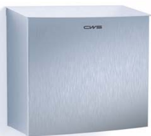
Hygienebox Edelstahl, 6l, Art.-Nr.: 7754000

Leicht aufklappbarer, selbstschliessender Deckel | innenliegender und somit unsichtbarer Beutelhalter für den Einsatz von Müllbeuteln | dank geringer Tiefe auch für kleine, enge Toilettenkabinen geeignet | ca. 6 Liter Volumen | zur einfachen Befestigung an der Wand